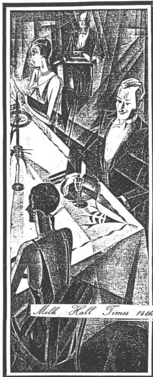
Milk Hall Times 14th